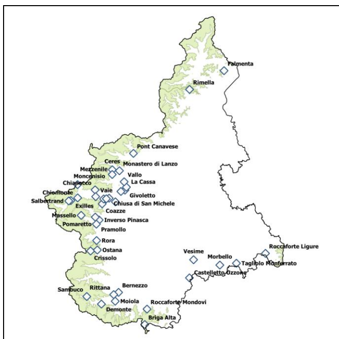
Fig. 3. Mappa delle località che presentano attestazioni toponimiche collegate all'attività carbonifera